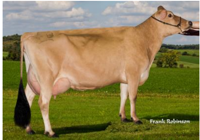
Mãe: Faria Brothers Harris Wallace{5}-ET