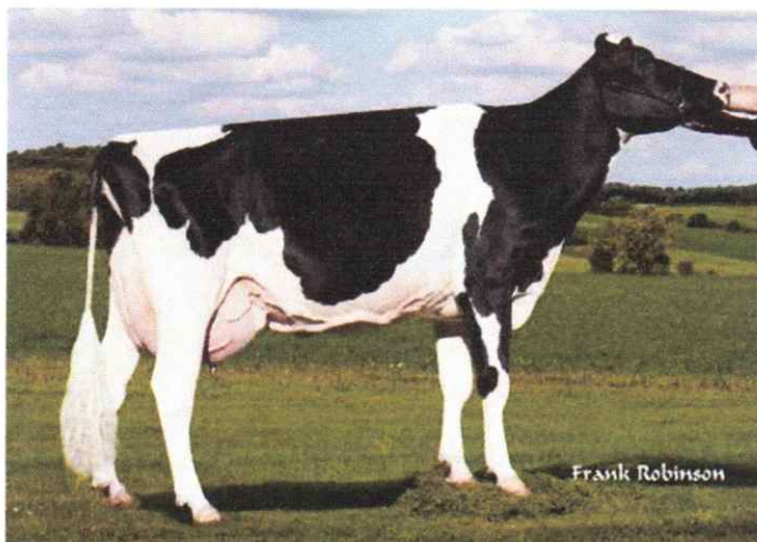
MGD: Edg Lacy Snow 2114