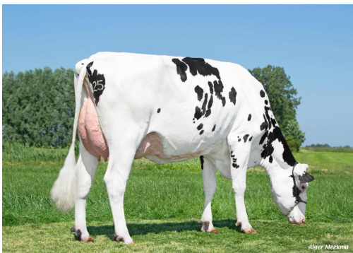
Delta Jodie - Mãe de Delta Foster PP

© CRV - Valores genéticos publicados em 03/12/2024 | HPB HOL