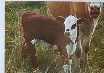
Progênie do Rumo em rebanho comercial