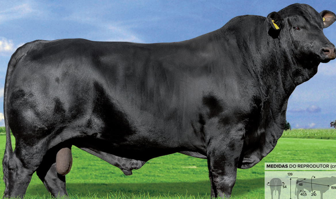
MEDIDAS DO REPRODUTOR (cm)