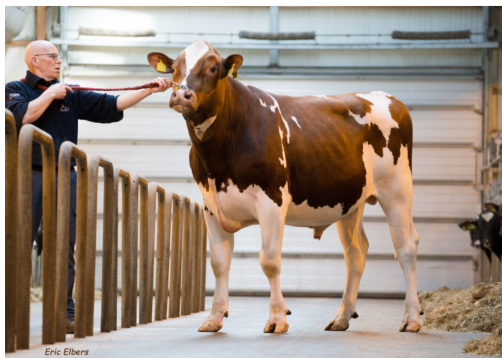
Delta Vision PP Red

© CRV - Valores genéticos publicados em 03/12/2024 | HVB HOL