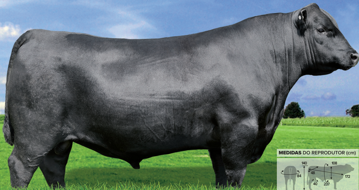
MEDIDAS DO REPRODUTOR (cm)