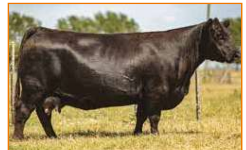
Rubeta 6298, Hermana materna de Renacido ▲

BENJAMIN 1547 ZORZAL LIDER ERRE TE 383 CONDOR EURO-T/E- ERRE TE 27 GRINGA TOLUCA-T/E-