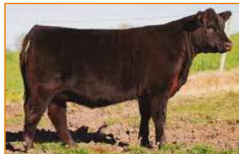
Ternera hija de Renacido ▲